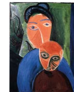
Pablo Picasso Madre e hijo, 1907 Óleo sobre lienzo Museo Picasso París