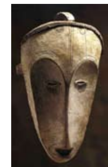
Máscara Fang Gabon Museo du quai Branly París

¿VE UD. ESTAS MÁSCARAS USADAS COMO FACCIÓNES EN OTROS CUADROS DE WIFREDO LAM?