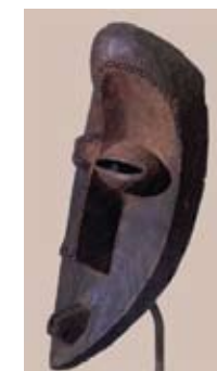
Máscara Mahongwe La República del Congo Museo de Arte Moderno Nueva York