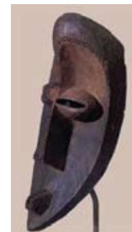
Máscara Mahongwe La República del Congo Museo de Arte Moderno Nueva York