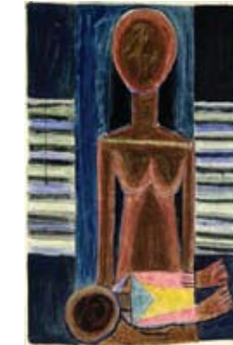
Wifredo Lam Madre e hijo, 1939 Óleo sobre lienzo Museo de Arte Moderno