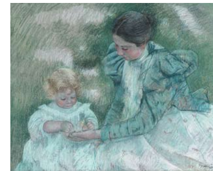
Mary Cassatt Madre Jugando con Hijo, 1897 Pastel sobre papel tejido, montado en cartón Museo Metropolitano de Arte New York

Mire Ud. los cuadros abajo de Madre e Hijo por Pablo Picasso y Mary Cassatt. ¿Cómo son similares estos cuadros al cuadro de Lam, Madre e hijo? ¿Cómo son diferentes?