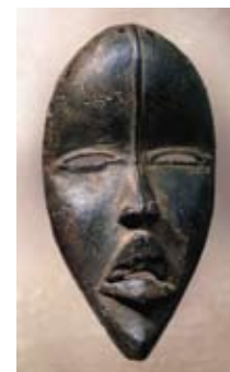
Máscara Dan Costa de Marfil Museo Reitberg Zurich