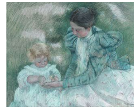
Mary Cassatt Madre Jugando con Hijo, 1897 Pastel sobre papel tejido, montado en cartón Museo Metropolitano de Arte New York

Mire Ud. los cuadros abajo de Madre e Hijo por Pablo Picasso y Mary Cassatt. ¿Cómo son similares estos cuadros al cuadro de Lam, Madre e hijo? ¿Cómo son diferentes?