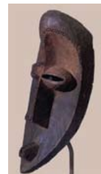
Máscara Mahongwe La República del Congo Museo de Arte Moderno Nueva York