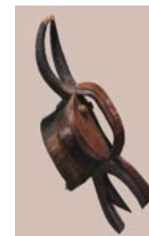
Máscara Baule Costa de Marfil Museo Picasso París