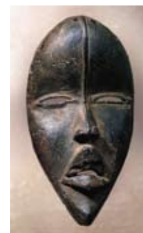
Máscara Dan Costa de Marfil Museo Reitberg Zurich