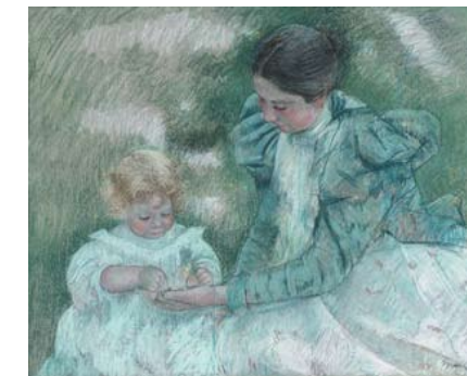
Mary Cassatt Madre Jugando con Hijo, 1897 Pastel sobre papel tejido, montado en cartón Museo Metropolitano de Arte New York

Mire Ud. los cuadros abajo de Madre e Hijo por Pablo Picasso y Mary Cassatt. ¿Cómo son similares estos cuadros al cuadro de Lam, Madre e hijo? ¿Cómo son diferentes?