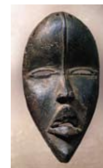
Máscara Dan Costa de Marfil Museo Reitberg Zurich